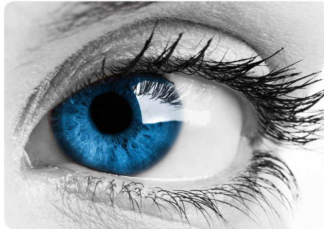
Abbildung eines gesunden Auges

Besonders Bakterien der Staphylokokkus-Familie produzieren einen Biofilm aus Ablagerungen, in dem sich die Haarbalgmilben (Demodex) wohlfühlen und sich stark vermehren können.